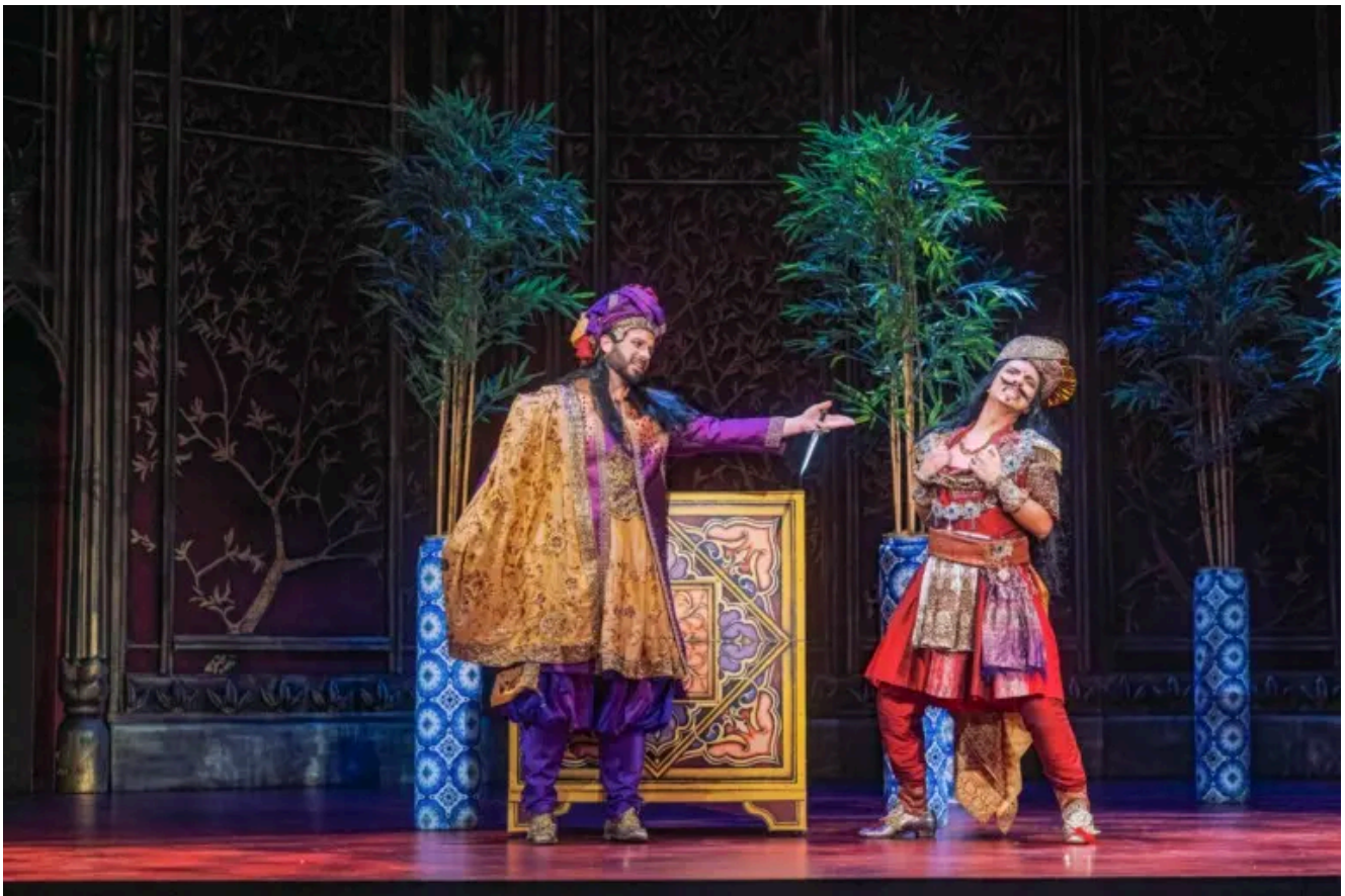
Szenenbild aus „Alessandro nell'Indie“