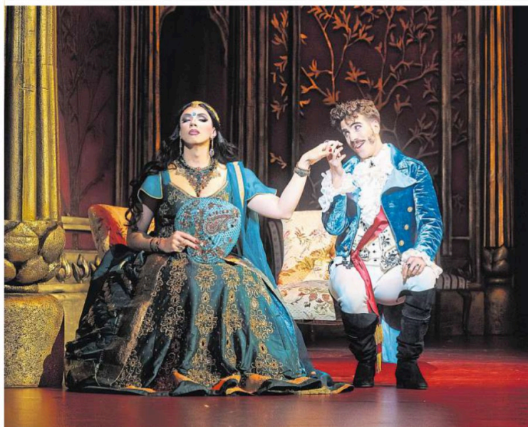
Der Indienfeldzug Alexanders des Großen, erzählt mit Anleihen beim Bollywood-Kino.