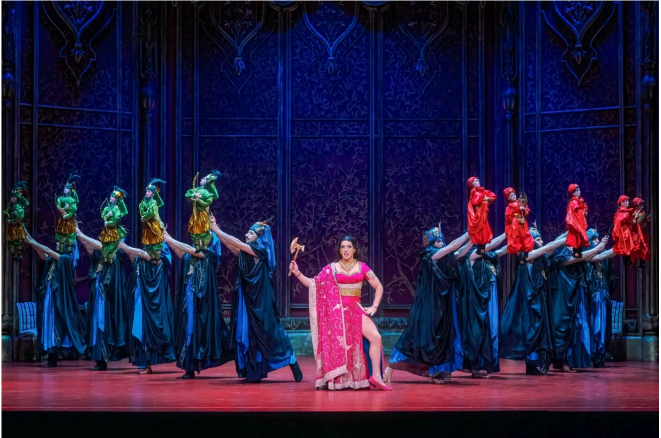
Szenenbild aus „Alessandro nell'Indie“