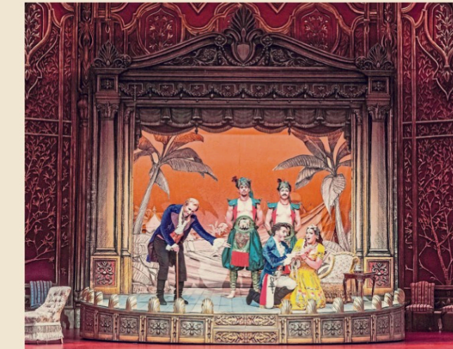
Die Aufführung von Leonardo Vincis barockem Sangesdrama „Alessandro Nell'Indie“ findet im Theater an der Wien statt.

Nun muss man zu Vincis Oper noch etwas wissen: Ihre Uraufführung ging komplett ohne weibliche Beteiligung vonstatten. Im päpstlichen Rom des 18. Jahrhunderts hatte die Frau nicht nur in der Kirche zu schweigen, sondern auch auf der Opernbühne –