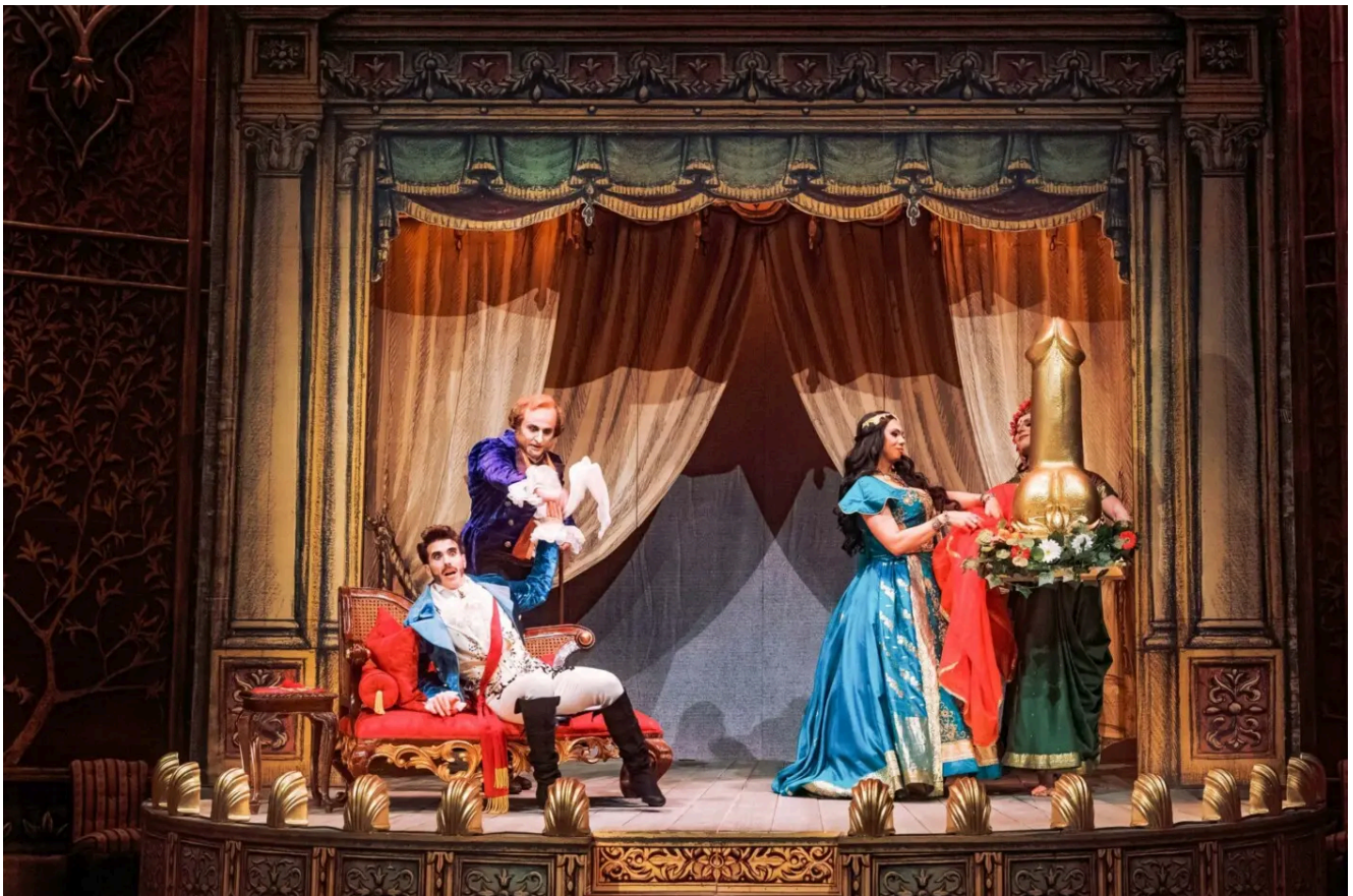
Szenenbild aus „Alessandro nell'Indie“